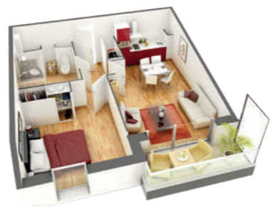
Exemple de disposition pour un appartement 2 pièces